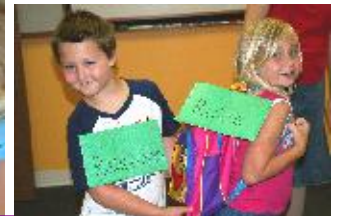
Esta página: familia campamento en el Monte. Castaño en Butler, PA