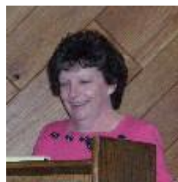
Esta página: una parodia, varios oradores, becas y actividades de la capilla de Damas Retiro